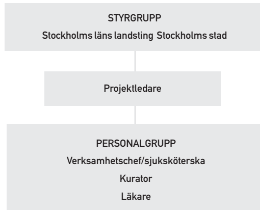
Figur 1. Järva mansmottagnings organisation

I denna utvärdering blir forskar-/utvärderarrollen ett etiskt dilemma på grund av mitt engagemang i projektet och min position i projektets organisationsstruktur, se nedanstående figur (figur 1). Funktionen som projektledare innebär att jag har en nära koppling både till projektets styrgrupp och till personalgruppen.